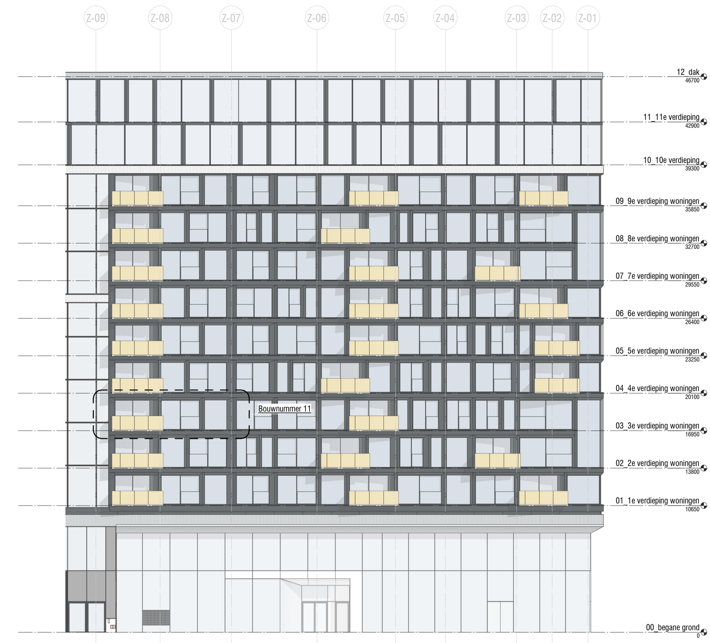
3 1:200 West gevel