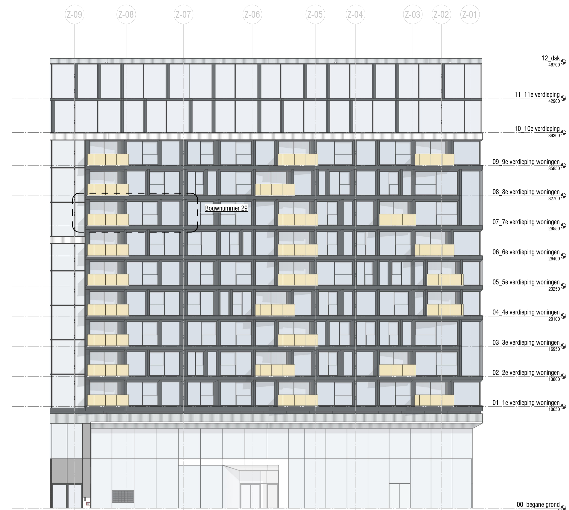
3 1:200 West gevel