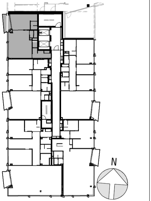
4 1:500 overzicht 4de verdieping